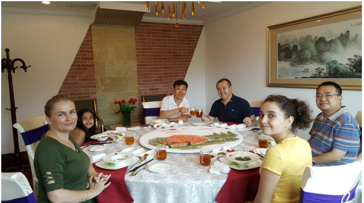
美国专家来碧水湾考察，对碧水湾的服务和管理赞不绝口，表示“再也不想离开碧水湾！”