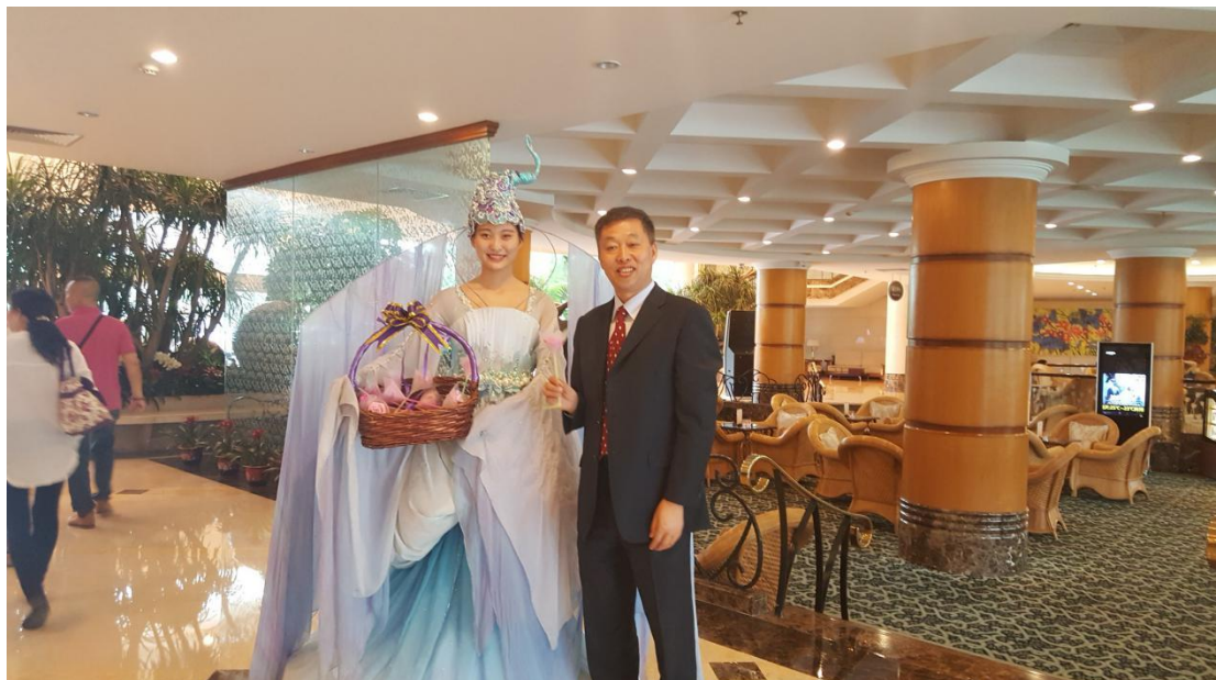
碧水湾“水仙子”在度假村大堂迎宾