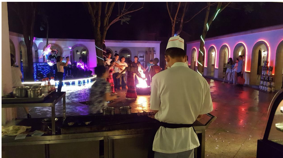
碧水湾音乐篝火晚会，给了学员们彻底放松度假的感受。。。