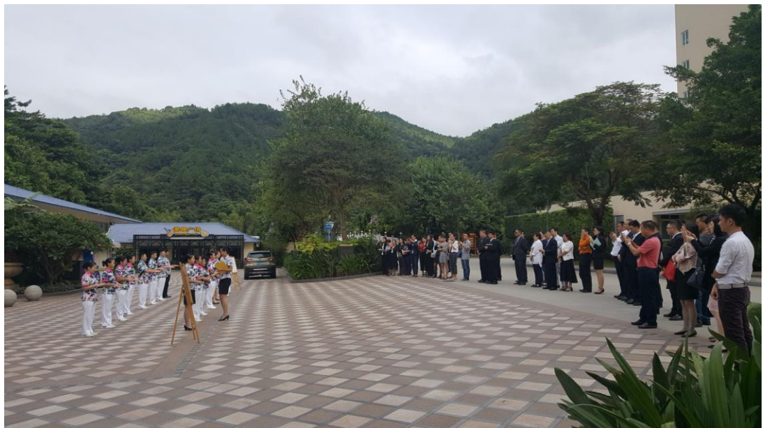
学员们在观摩碧水湾员工的班前培训