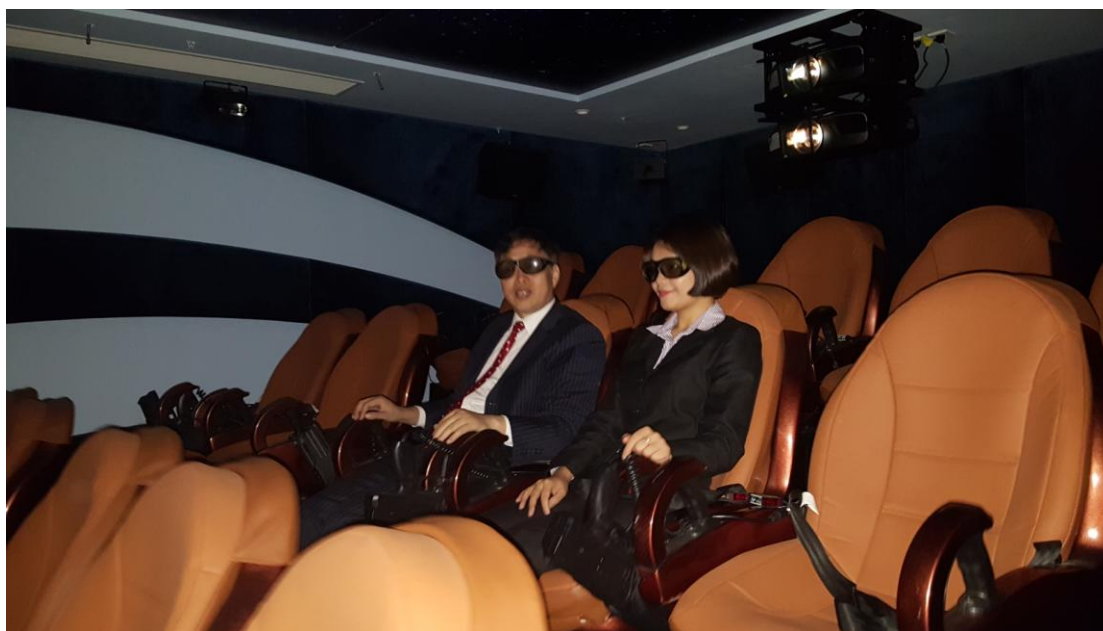
8D 影院：碧水湾又有新产品！